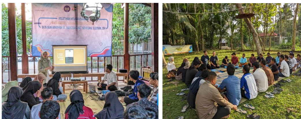
Gambar 2. Pelaksanaan Pelatihan Bahasa Inggris

Materi yang diberikan berupa pemahaman kosa kata ( vocabularies ) yang dapat digunakan untuk mempromosikan desa wisata. Selain itu, peserta karang taruna juga diberi bimbingan terkait cara berkomunikasi dengan wisatawan asing terkait penjelasan secara detail mengenai objek-objek wisata yang terdapat di Dusun Krapyak IX. Menggo et al., (2022) menyatakan bahwa hal penting yang harus diperhatikan dalam mengembangkan desa wisata adalah komunikasi yang baik dengan menggunakan Bahasa Inggris yang kompeten. Dengan adanya kemampuan berkomunikasi dan berinteraksi menggunakan bahasa Inggris yang kompeten dapat menunjang kelancaran dan kesuksesan desa wisata (Murti & Kusuma, 2023).