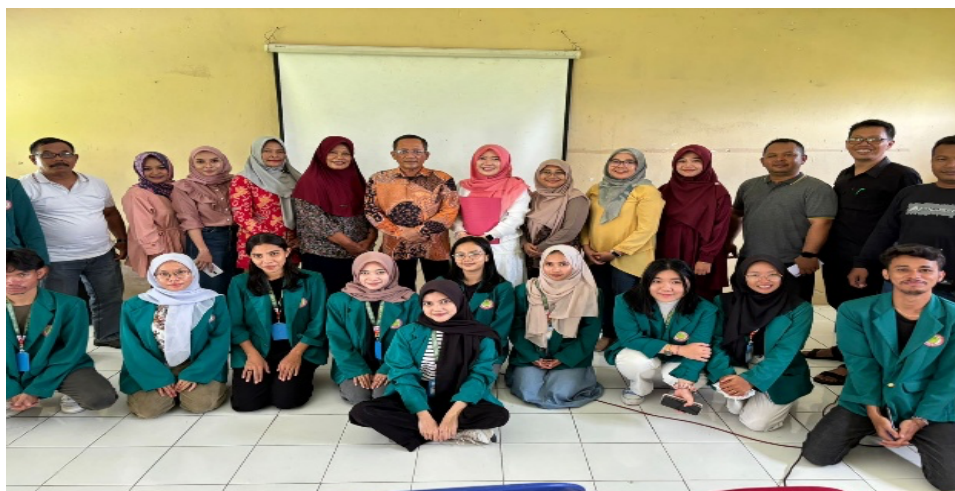
Gambar 2. Sosialisasi dan Pelatihan

meningkatkan kemampuan mereka dalam pengambilan keputusan finansial yang lebih baik di BUMDes Lumintu.