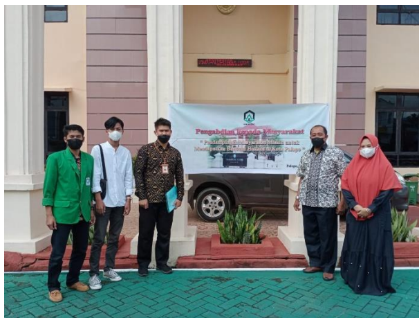
Gambar 3. Foto bersama tim pengabdian dengan pihak PA Kota Palopo