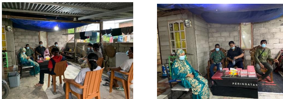
Gambar 5. Sosialisasi

juga dilaksanakan diskusi atau sharing pengalaman dari masyarakat miskin yang pernah atau sedang menjalani kasus hukum.