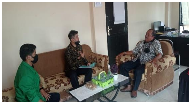
Gambar 2. Tim Pengabdian berkoordinasi dengan pihak panitra