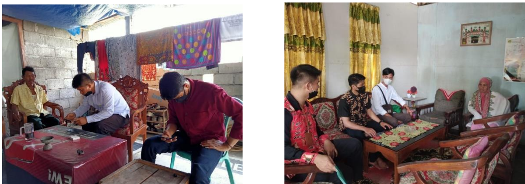
Gambar 4. Berkunjung ke rumah warga di kelurahan songka