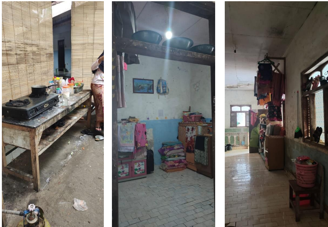
Gambar 3 Suasana Lingkungan Pondok Pesantren Adduriyah Nyantren Pamekasan Madura

Meningkatkan pemberdayaan di lingkungan pondok pesantren merupakan upaya untuk warga pondok pesantren selalu mengenal dan memahami masalah yang dihadapi (Zakiudin, 2016), sehingga salah satu upaya perubahan adalah mampu untuk merencanakan dan melakukan upaya pemecahan masalah dengan memberikan memanfaatkan potensi setempat sesuai dengan kondisi situasi kebutuhan setempat (Mustajib, 2020). Sebagai upaya memberikan fasilitas tersebut sangat diharapkan dalam mengembangkan potensi warga pondok pesantren sebagai perintis/pelaku dan pemimpin yang dapat menggerakkan masyarakat berdasarkan asas kemandirian dan kebersamaan. Kegiatan yang dapat dilakukan dalam mengelola pondok, lebih mengutamakan upaya promotif dalam hal bidang pelayanan promotif dan preventif, tanpa mengabaikan sisi kuratif dan rehabilitatif dengan dilandasi sikap semangat dengan gotong royong dan kebersamaan, diharapkan dapat mampu memberikan suasana pondok pesantren yang sehat (Machfutra et al., 2019).