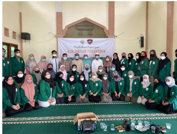
Gambar 2 Kunjungan dan Survey Lokasi Pondok Pesantren Adduriyah Nyantren Pamekasan Madura