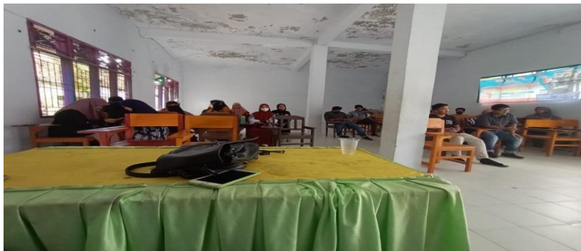
Gambar 4. Mahasiswa mengisi kuisisioner terhadap produk VCO

Pada tahap evaluasi, sebelumnya kami melakukan pemberian kuisisioner Pretest kepada 50 mahasiswa fakultas ekonomi dan bisnis di Universitas Muhammadiyah Palopo sebagai tolak ukur minatnya terhadap produk VCO sesuai yang dibahas pada tahap input (pra produksi), sehingga dapat disimpulkan bahwa mahasiswa berminat dengan produk VCO.