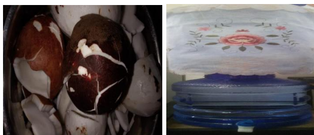
Gambar 1. Pemilihan Bahan (Kelapa dan air galon)

Adapun bagian hasil dan pembahasan yaitu menjelaskan dan menguraikan tentang: