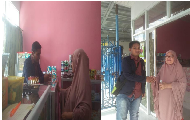
Gambar 5. Pemasaran di apotek