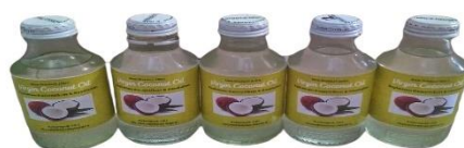
Gambar 3. Output ( Virgin Coconut Oil )

Adapun hasil dari virgin coconut oil ini adalah sebagai berikut: