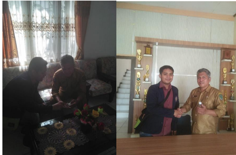
Gambar 4. Pemasaran di kantor camat