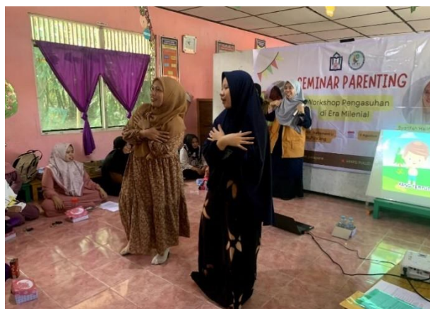
Gambar 3. Games oleh peserta/orangtua