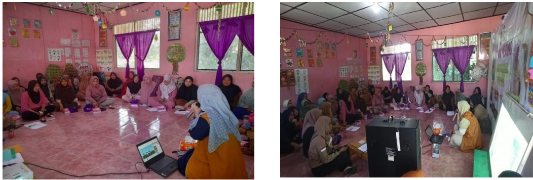
Gambar 1. Penyampaian materi pendidikan seksual anak usia dini