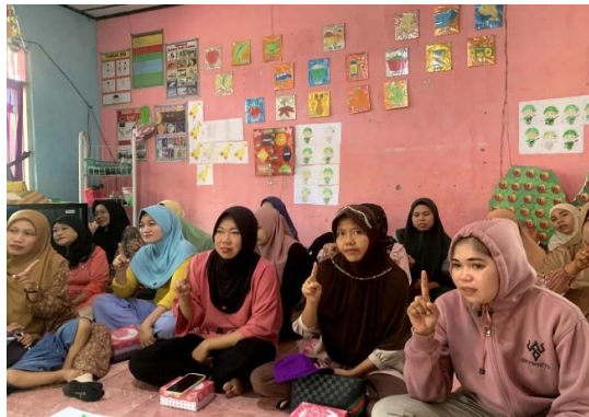
Gambar 2. Peserta/orangtua