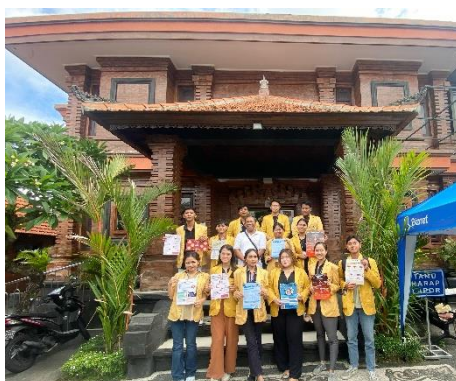
Gambar 3. Pelaksanaan Kegiatan

Pada tahap implementasi, rencana yang telah disusun mulai diwujudkan dan dijalankan. yakni, pada tanggal 30 Januari 2024, dilakukan penyebaran atau penempelan flyer di setiap banjar. Tindakan ini bertujuan untuk meningkatkan pemahaman masyarakat, terutama pemilih pemula atau Gen Z, mengenai alur proses Pemilu serta mendorong partisipasi mereka. Dengan demikian, langkah-langkah konkrit seperti penyebaran flyer menjadi sarana untuk mencapai tujuan tersebut dalam proyek atau program kerja pengabdian Masyarakat yang sedang dilaksanakan.