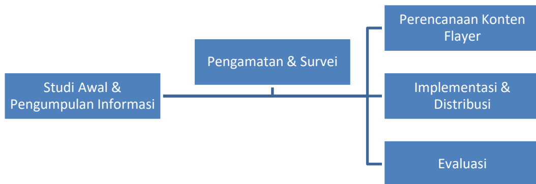
Gambar 1. Metode Pelaksanaan

Pengabdian Masyarakat diadakan oleh Universitas Pendidikan Nasional yang bertempat di Desa Peguyangan Kangin. Desa Peguyangan Kangin, dengan luas wilayah sekitar 4,16 km 2 , berbatasan dengan Desa Tonja, Peguyangan Kaja & Peninjon. Pengesahan status Desa Peguyangan Kangin sebagai sebuah desa resmi terjadi pada tahun 2004, sesuai dengan Surat Keputusan Nomor 15 tahun 2004 (Gusti Ayu Dewi Lestari, 2020), dengan fokus pada kolaborasi dengan Komisi Pemilihan Umum (KPU) Kota Denpasar, merupakan sebuah inisiatif yang bertujuan mulia dalam memajukan proses demokrasi dan meningkatkan partisipasi aktif generasi muda dalam pemilihan umum. Dengan kegiatan ini, mahasiswa menjadi agen perubahan yang menggerakkan kesadaran Masyarakat akan pentingnya hak suara mereka dan membangun budaya partisipatif dalam proses pemilihan. Dilaksanakan pada tanggal 30 Januari 2024. Dimana melalui kolaborasi antara mahasiswa Universitas Pendidikan Nasional dan KPU Kota Denpasar, diharapkan dapat tercipta sebuah momentum positif dalam membangun kesadaran dan partisipasi generasi muda dalam menjalankan hak suara mereka serta memperkuat fondasi demokrasi di Desa Peguyangan Kangin.