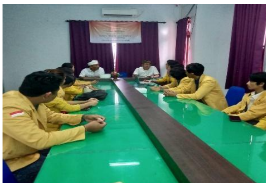
Gambar 2. Pengumpulan Informasi

11 banjar, dengan pembagian yang sesuai. Untuk pelaksanaan kegiatan ini, disarankan agar flyer mulai disebar H-5 sebelum pemilu dilaksanakan.