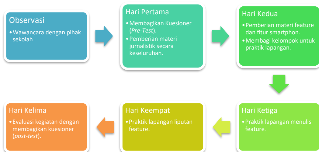
Gambar 2. Diagram Alir Metode Pelaksanaan Kegiatan

Pada hari terakhir merupakan evaluasi, yakni bertujuan agar mengetahui tingkat pemahaman siswa mengenai pengetahuan jurnalistik melalui pemanfaatan smartphone setelah mengikuti pendampingan selama 5 hari (Busri et al., 2023).