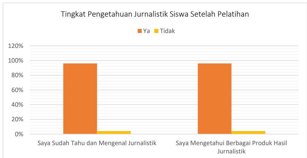
Gambar 6. Hasil Post-Test

Hari terakhir merupakan tahap evaluasi setelah dilakukan pendampingan selama lima hari, penulis memberikan lagi kuesioner dengan pertanyaan yang sama sebagai tolak ukur keberhasilan. Hasilnya menunjukkan bahwa sebanyak 96% peserta menjadi tahu seputar dunia jurnalistik melalui pemanfaatan smartphone. Tidak hanya itu, sebanyak 81% peserta menjadi lebih tertarik dengan bidang jurnalistik.