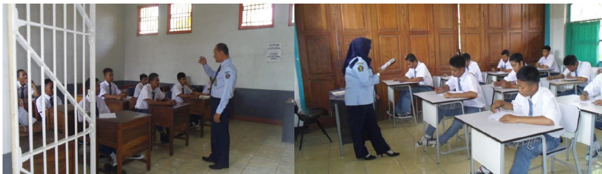
Gambar 7. Peserta Pelatihan Sedang Praktik Mengajar di Kelas

Pada tahap kedua, kegiatan dilanjutkan dengan praktik mengajar. Sesi pelatihan ini merupakan lanjutan dari pembekalan materi terkait pengajaran. Para peserta diarahkan untuk mengajar secara riil di kelas yang diampu dengan menerapkan semua pengetahuan dan keterampilan yang diperoleh dari tahap kegiatan pengabdian masyarakat pertama. Pada tahap ini Tim Pengabdian berperan sebagai pendamping bagi para peserta pelatihan.