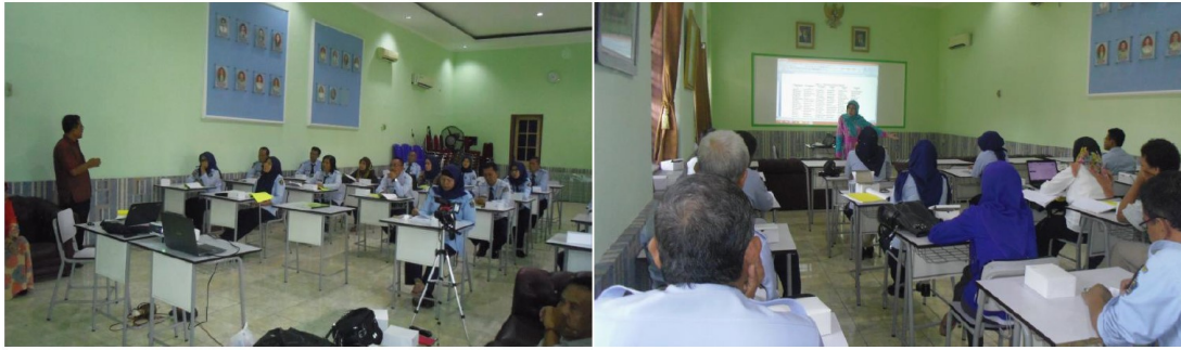
Gambar 2. Penyampaian Materi Secara Tatap Muka