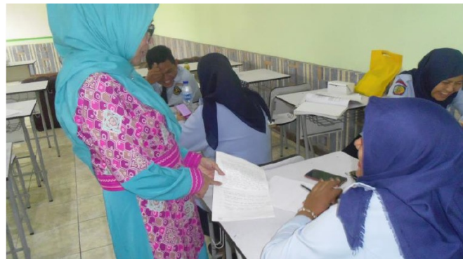
Gambar 3. Kegiatan Praktik Secara Berkelompok