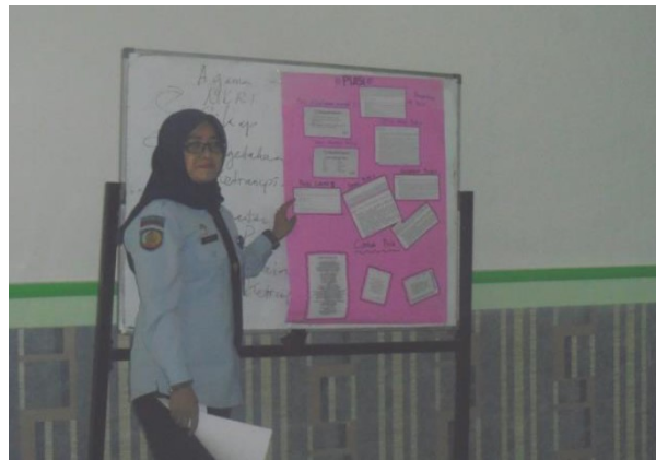
Gambar 6. Praktik Mengajar dengan Menggunakan Alat Peraga Karyanya

Sebelum sesi pelatihan ditutup, biasanya akan dilakukan kegiatan umpan balik. Melalui kegiatan ini diharapkan para peserta memberikan komentar terkait dengan materi dan pelaksanaan pelatihan yang sedang berjalan. Umpan balik ini sangat penting untuk dijadikan masukan dan pedoman dalam evaluasi, revisi, dan penyempurnaan materi dan pelaksanaan pelatihan berikutnya.