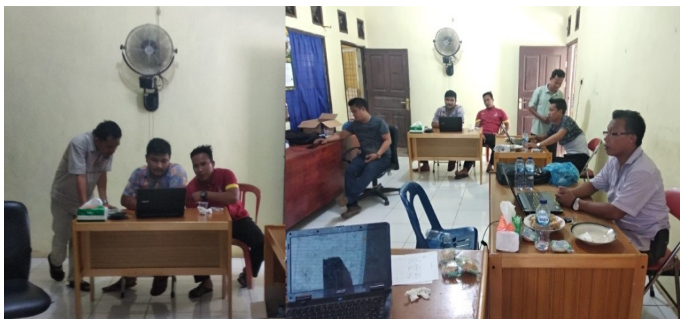
Foto 2. Simulasi penyusunan laporan keuangan

Kesungguhan peserta dalam melakukan simulasi laporan dapat terlihat dari foto dibawah: