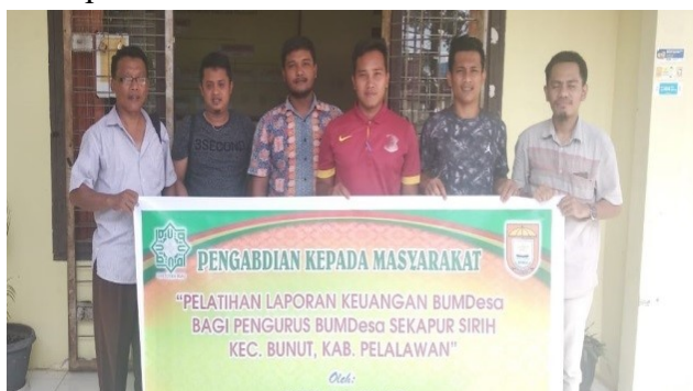
Foto 3. Foto bersama setelah kegiatan pelatihan

Diakhir pelatihan pengabdian bersama pengurus menyempatkan sesi foto bersama seperti terlihat pada foto berikut: