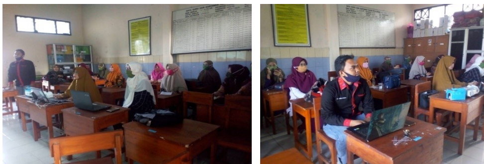
Gambar 5: Aktifitas Peserta saat Menyimak Pemaparan Materi

tidak perlu menayangkan soalnya, tetapi cukup siswa melihat pada layar gawai mereka masing-masing.