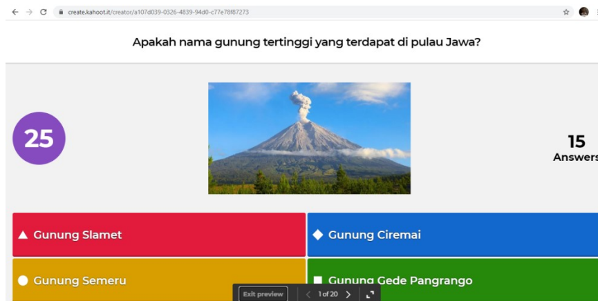
Gambar 4: Tampilan Kuis Kahoot Karya Salah Satu Peserta

Setelah sesi penyampaian materi Kahoot selesai, peserta pelatihan mulai berlatih untuk mengoperasikan platform pembelajaran ini. Dengan bimbingan dan arahan dari pemateri, peserta pelatihan mulai mengikuti tahapan demi tahapan pengoperasian Kahoot . Instruksi yang diberikan oleh pemateri kepada peserta pelatihan adalah membuat 10 soal kuis menggunakan Kahoot dengan mata pelajaran atau materi sesuai dengan keinginan peserta pelatihan. Pada tahapan log in platform kahoot , seluruh peserta tidak mengalami kesulitan karena mereka sudah memiliki akun e-mail masing-masing. Setelah berhasil log in Kahoot , semua peserta sangat antusias mulai menyusun kuis yang kreatif di platform pembelajaran tersebut. Waktu penyusunan kuis telah selesai, pemateri meminta dua peserta tes untuk mengujikan karya kuis nya kepada peserta tes lain. Dalam kegiatan ini seluruh peserta sangat antusias mengikuti permainan kuis tersebut.