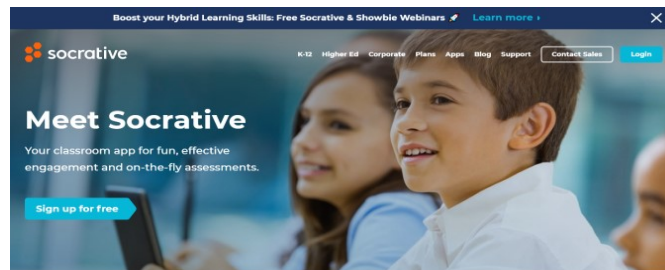
Gambar 1: Tampilan Menu Utama Socrative

Pelaksanaan kegiatan pelatihan dilakukan secara daring dengan menggunakan platform video conference Zoom . Kegiatan pelatihan dilaksanakan secara daring untuk mematuhi protokol kesehatan di tengah pandemi Covid-19 yang telah ditetapkan oleh pemerintah. Ada dua platform pembelajaran yang dikenalkan dalam pelatihan ini yaitu Kahoot dan Socrative . Di setiap pelatihan masing-masing platform pembelajaran, pelatihan dibagi menjadi dua sesi yaitu pengenalan platform dan praktik menggunakan platform dalam pembelajaran. Ketika sesi praktik membuat kuis, setiap 3 peserta pelatihan mendapatkan pendampingan dari 1 dosen STKIP Al Hikmah yang sudah memiliki pengalaman menggunakan platform pembelajaran. Kegiatan pendampingan ini sangat penting dilakukan dalam pelatihan sangat perlu melibatkan banyak pendamping yang memiliki pengalaman mengajar (Putri, dkk, 2020).