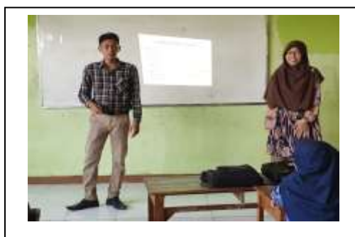
Gambar 3. Demonstrasi bermain drama