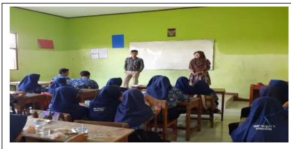
Gambar 1. Sosialisasi berlatih drama

Peningkatan pengetahuan pra dan pasca materi diberikan dapat dilihat pada gambar berikut ini.