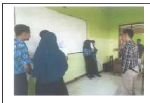
Gambar 4. Evaluasi hasil praktik siswa

Setelah kegiatan demonstrasi selesai, dilanjutkan dengan dipraktikkan secara langsung oleh siswayang didampingi tim pengabdian masyarakat. Pementasan dilaksanakan di dalam kelas dengan satu naskah drama pendek oleh semua siswa yang dibagi beberapa kelompok. Kelompok yang belum mendapatkan giliran pementasan, diajak untuk mengamati. Pementasan kurang lebih berdurasi 15 Menit sampai 20 menit. langkah-langkah singkat pentas drama adalah sebagai berikut.