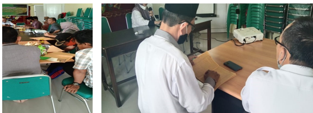
Gambar 4. Kegiatan praktik membaca kitab kuning

Pada pelaksanaan kegiatan praktik dilaksanakan pada hari terakhir kegiatan setelah selesai kegiatan pemberian materi tentang tentang kaidah-kaidah dan kunci baca kitab kuning beserta contoh-contoh kaidah i'rab dalam bahasa Arab. Dalam kegiatan praktik ini peserta diarahkan secara langsung untuk membaca kita kuning sesuai arahan dari tim pelaksana kegiatan selain itu peserta didampingi secara langsung oleh tim pelaksana dalam proses pembacaan kita kuning. Tujuan kegiatan praktik ini bertujuan untuk melihat kemampuan membaca sesuai dengan kaidah bahasa arab dan kemampuan memahami kaidah bahasa arab dalam hal ini kitab kuning. Bisa kita lihat pada gambar dibawah ini kegiatan praktik secara langsung yang dilakukan oleh peserta dalam membaca dan memahami kitab kuning.