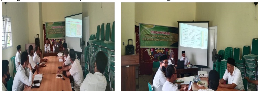
Gambar 3. Pemberian materi tentang Kaidah-kaidah dan kunci baca kitab kuning beserta contoh-contoh kaidah i'rab dalam bahasa Arab

Pada hari ke tiga merupakan hari terakhir dalam pemberian materi dalam kegiatan Pelatihan Membaca Kitab Kuning bagi Penghulu. Dihari ketiga ini dilaksanakan pada tanggal 30 Juli 2021. Pada kegiatan pemberian materi ini peserta diberikan materi tentang Kaidah-kaidah dan kunci baca kitab kuning beserta contoh-contoh kaidah i'rab dalam bahasa Arab. Materi ini dibawakan oleh bapak Drs. Alwi Yunus, M.H. Materi ini bertujuan memberikan penguatan kepada peserta tentang kaidah dalam membaca kitab kuning dan narasumber juga memberikan contoh-contoh pembacaan kaidah dalam bahasa arab. Bisa dilihat pada gambar dibawah ini pemberian materi dihari ketiga.